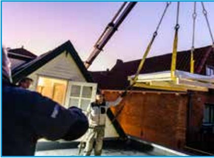
Plaatsen nabij raveling. Hijsstropen onder de pallet

Het daklicht wordt compleet prefab geleverd. De beglazing is af fabriek al verwerkt in het kader en aan de opstand bevestigd. Het element wordt met pallet in de buurt van de daksparring gehesen. Dan losgemaakt van de pallet waarna dezelfde hijsstropen om de aanvullende hijsconstructie kunnen. Zo plaatst u het Beloopbaar Daklicht met gemak op de raveling. Dan is het nog slechts vastschroeven aan het dak en aanbrengen van de dakbedekking.