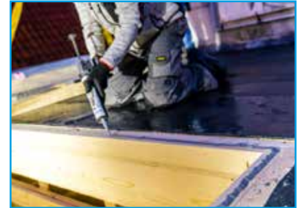
Aanbrengen kit op randbalk