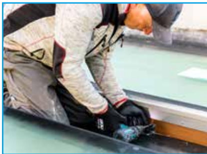
Vastzetten daklicht aan dakconstructie