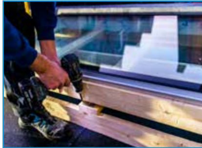
Losschroeven van de pallet